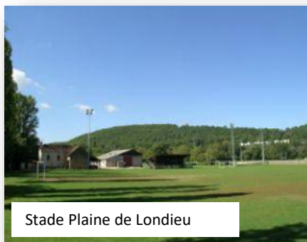
Stade Plaine de Londieu